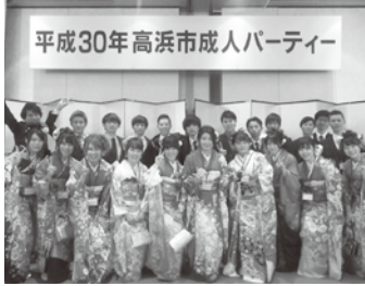
笑顔は高浜市のいちばんの宝物！